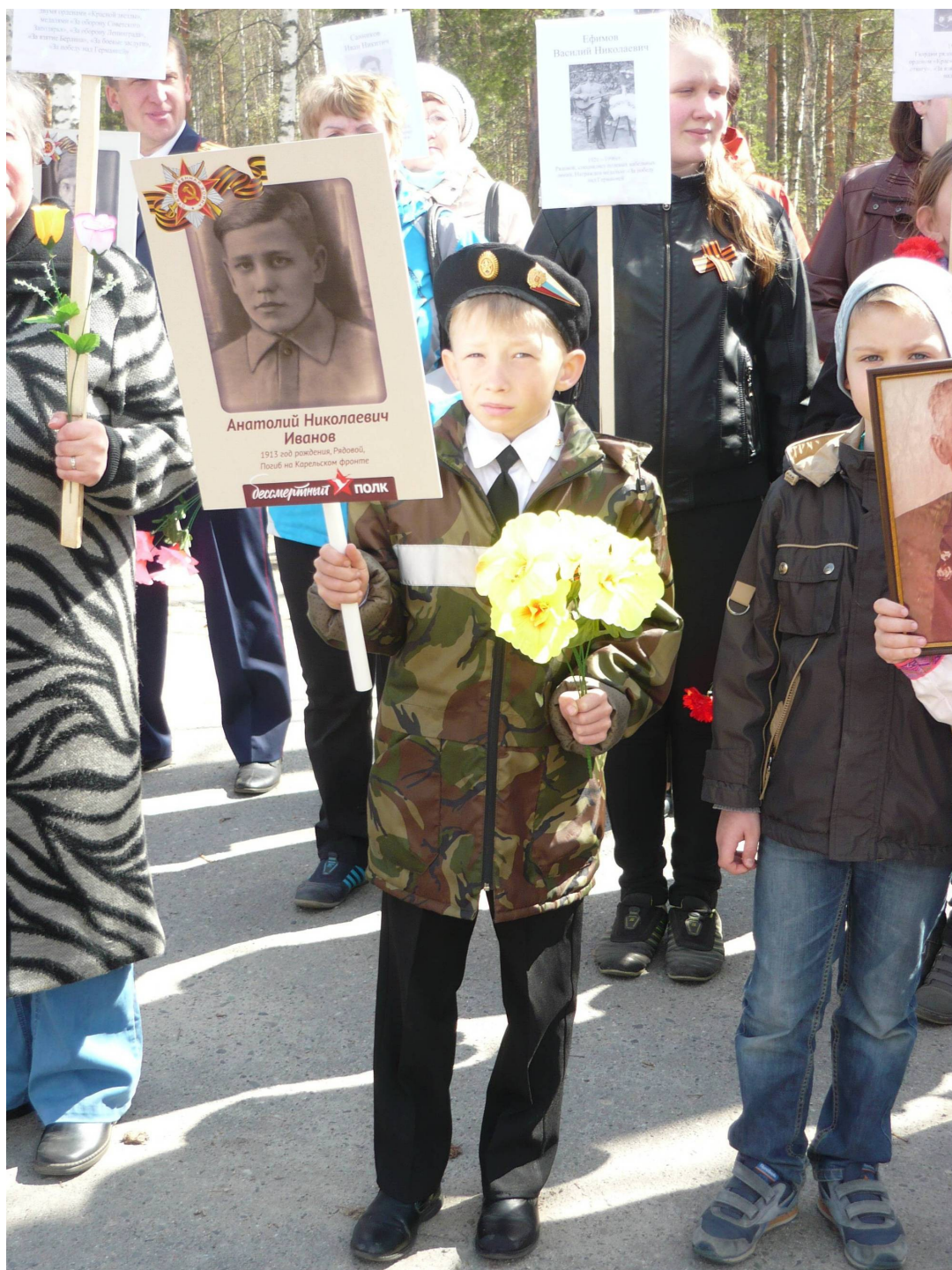
9 мая 2015 года.