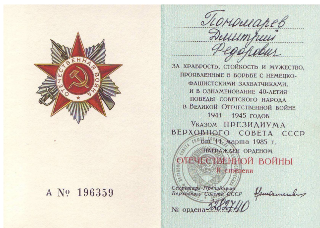
Удостоверение к ордену «Отечественной войны» второй степени.