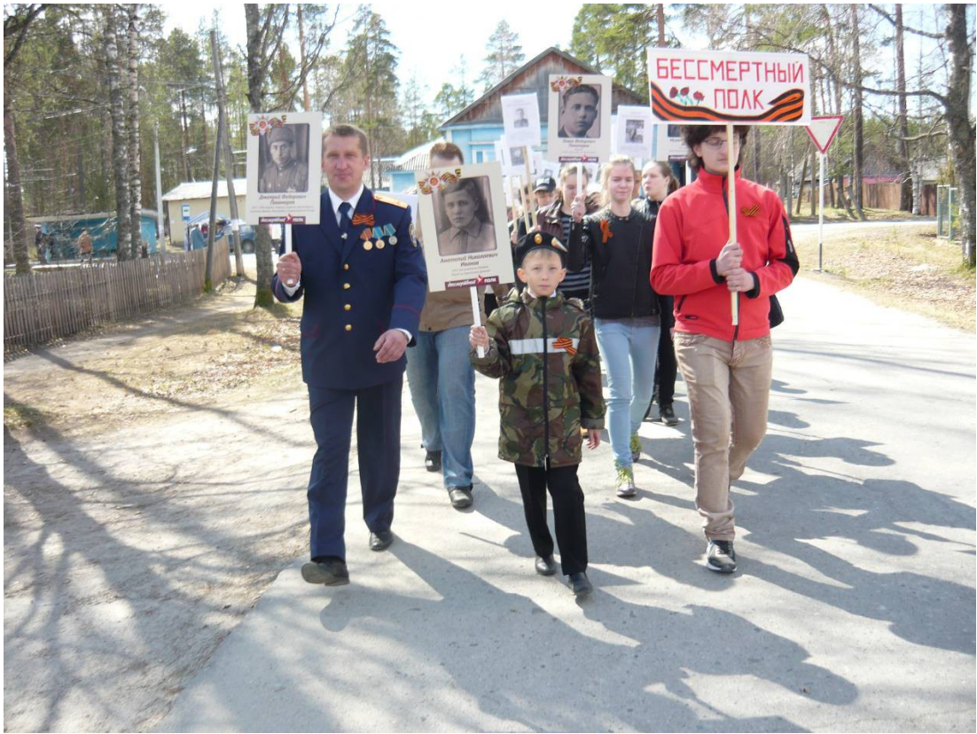
Бессмертный полк в поселке Гирвас.